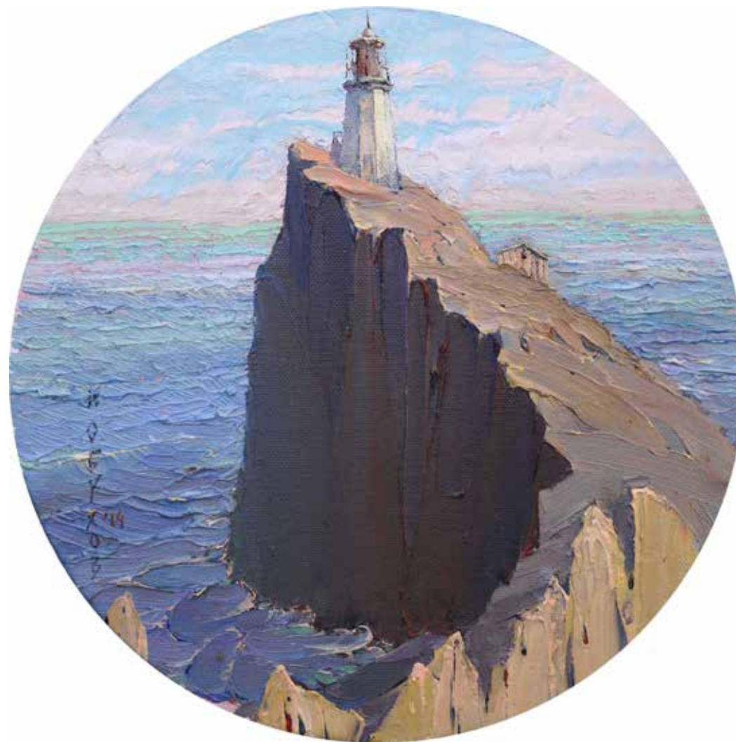
«Маяк». Light house